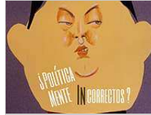
Carlos Avallone ¿Políticamente incorrectos? Hasta el 31 de octubre de 2019

Ateneo de Madrid expone los retratos de intelectuales y políticos firmados por el artista argentino y publicados en prensa. [ver+]