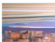
Cruce de Caminos Clausurada el 31 de mayo de 2019

Para mí el arte es aquello que me recuerda y me conecta con el profundo misterio de la existencia. [ver+]