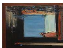
The colorful marks of women Clausurada el 27 de abril de 2019

Exposición "Retratos, reflejos del alma" de René Tellez. [ver+]